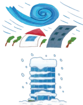
風・雹・雪災、水災による損害共済金の推移

平成26年豪雪による雪災、平成30年7月豪雨による水災、平成30年台風21号及び台風24号による風災といった様々な自然災害が発生し、共済金の支払いが増加していることから、共済掛金率を改定しました。